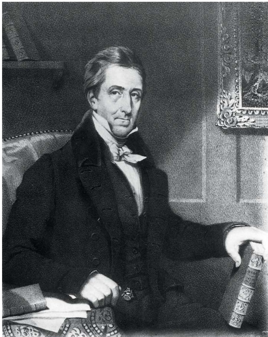
L'honorable Denis-Benjamin Viger (1774-1861).

Le problème des rapports entre Canadiens français et « Britanniques » (ou