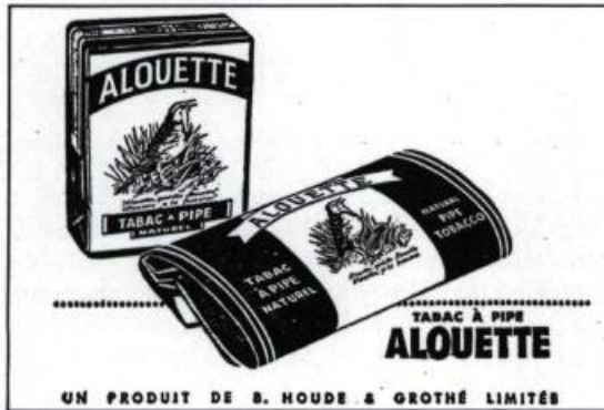
Le tabac Alouette, longtemps une marque fort appréciée des fumeurs de pipe. Publicité de la fin des années 1940.

Un jour vint, en 1899, où l'on vit à Québec des employés à la solde de l'American Tobacco, mués en «enseignes ambulantes», distribuer gratuitement des paquets de tabac aux piétons. La puissante firme cherchait à monopoliser la production et la vente des tabacs au Canada. Afin de s'assurer du marché, elle désirait mettre la main sur des entreprises locales. Les Dussault et les Lemesurier reçurent des offres d'achat. Devant leurs refus, l'American Tobacco mit en oeuvre divers moyens de pression.