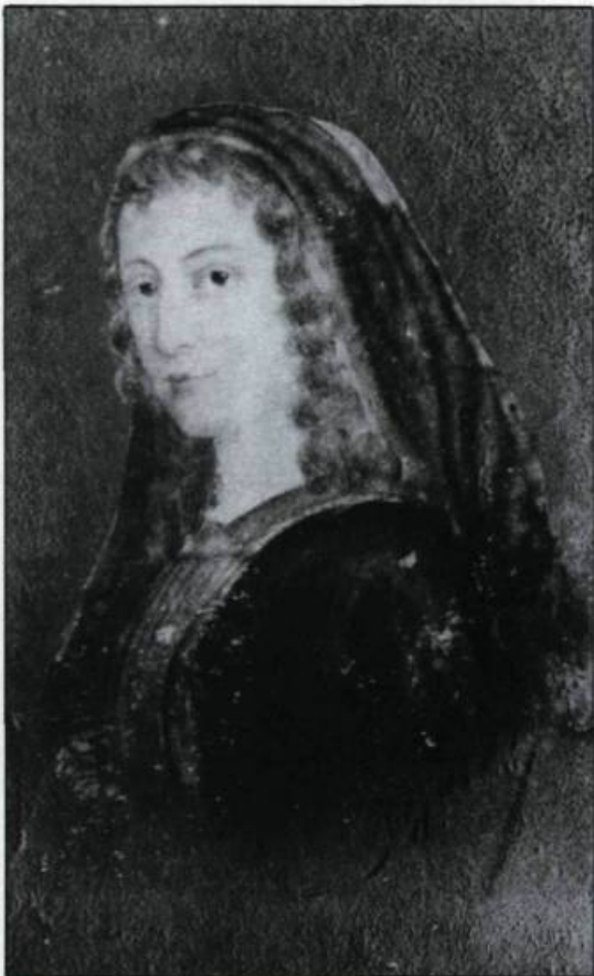
Jeanne Mance, née à Nogent-en-Bossigny, Champagne (1606-1673). Arrivée en même temps que Maisonneuve, en 1642 à Ville-Marie, elle y fonde, deux ans plus tard, l'Hôtel-Dieu.

Les Véritables Motifs , qui supportent les débuts de ce Montréal que nous connaissons aujourd'hui, sont sans doute d'inspiration plus sécularisée! Mais n'oublions pas que Montréal a d'abord été fondée pour des motifs religieux. Ces fondateurs n'étaient pas des fanatiques ni des illuminés. Par exemple, ils ne pensaient pas du tout occuper le territoire des autochtones; à Montréal comme en Europe, une terre non habitée appartient au premier occupant; et ils ont trouvé un Montréal désert même si des Iroquois y ont autrefois demeuré (2) . Leur rêve de fraternité par le travail agricole, l'éducation, le mariage entre Amérindiens et Français se teinte sans doute de paternalisme, mais il est marqué d'une générosité intelligente. ♦