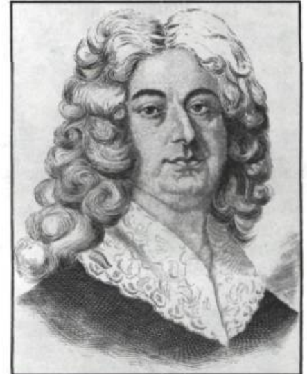
Gravure de Gilles Hocquart, intendant de la Nouvelle-France de 1729 à 1748. Tirée de l'Histoire des Canadiens français par Benjamin Sulte, tome V, Montréal, 1882.

lon qui se trouve au sud-est. Un petit bureau est aménagé à côté de chacun des dépôts. Le tout est voûté et pavé de carreaux de pierre et de brique. Seules les armoires, portes et fenêtres ont été fabriquées en bois. Les coûts atteignent 2738#. À la fin de l'automne 1733, une fois les vaisseaux partis, Hocquart fait déposer dans les voûtes du Palais les archives du Conseil supérieur et de la Prévôté de Québec ainsi que les greffes des notaires décédés.