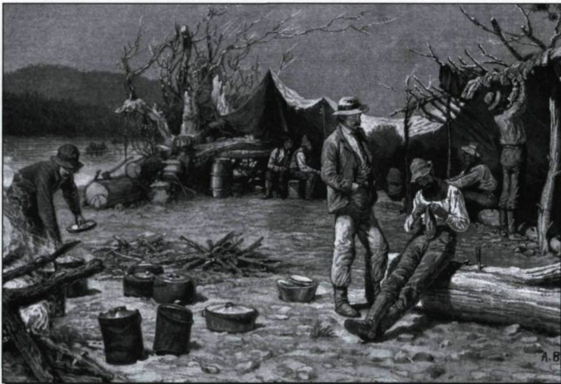
Un camp de draveurs le long d'un affluent de la rivière Saguenay. Dans cette région, le travail de la drave est partagé entre ceux qui roulent simplement les billots dans la rivière et ceux qui préviennent ou défont les embâcles, métier beaucoup plus dangereux. Gravure publiée dans le Harper's Magazine, en 1888.