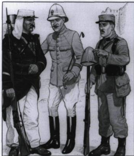
Légionnaires lors de la campagne d'Afrique du Nord de 1903-1911.