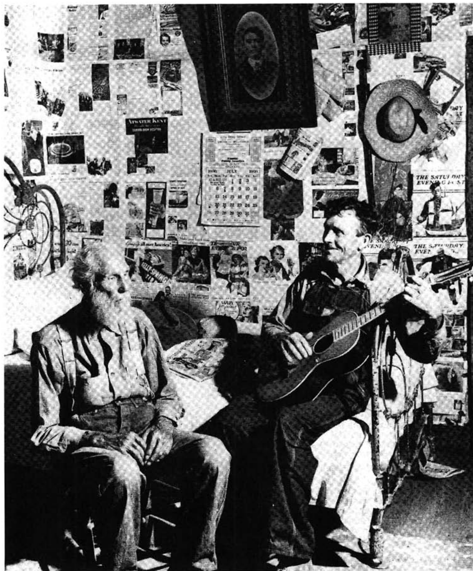
Margaret Bourke-White, Life Magazine, © Time, Inc.