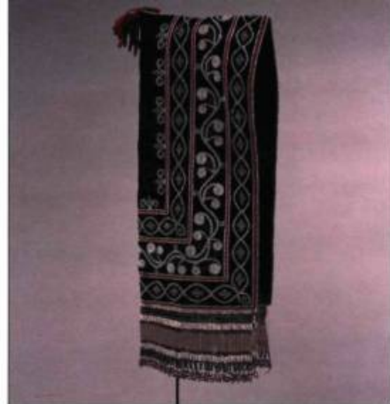
Photo : Musée McCord, don de M.C.S. Rackstraw au Musée McCord, ME954.1.2

Ce capuchon, création d'une femme crie de la Baie-James vers 1850, est fait de drap de Stroud bleu et décoré de rubans de soie, de coton et de perles de verre.