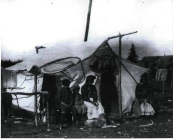
Captée vers 1920, cette photographie témoigne de la vie traditionnelle des Innus de Mingan en Moyenne-Côte-Nord.

Photo : George R. Lighthall, don de W. D. Lighthall au Musée McCord, MP-0000.361.11