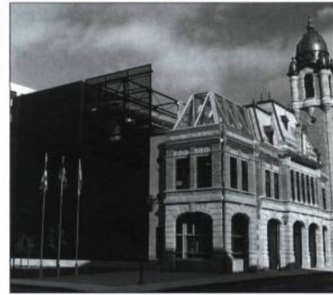
L'ancienne caserne Dalhousie, aujourd'hui le centre de production multimédia Ex-Machina.

La Ville de Québec devra également faire la lumière sur le processus de décisions qui a mené à la démolition de l'ancienne banque du boulevard Charest. Ce n'est qu'en identifiant les lacunes des processus d'encadrement et en adoptant des mesures de contrôle qu'on évitera de se retrouver à nouveau dans de telles situations. Les erreurs qui continuent de se produire dans notre milieu après qu'elles ont été dénoncées partout ailleurs achèvent de nous convaincre de la nécessité urgente que le Québec se donne enfin une