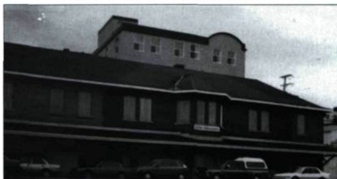
La gare, abandonnée en 1987 (photo ci-contre), a été réhabilitée en 1995 (photo en haut). Ce projet est un bel exemple de valorisation du patrimoine local. Il abrite aujourd'hui un complexe commercial.