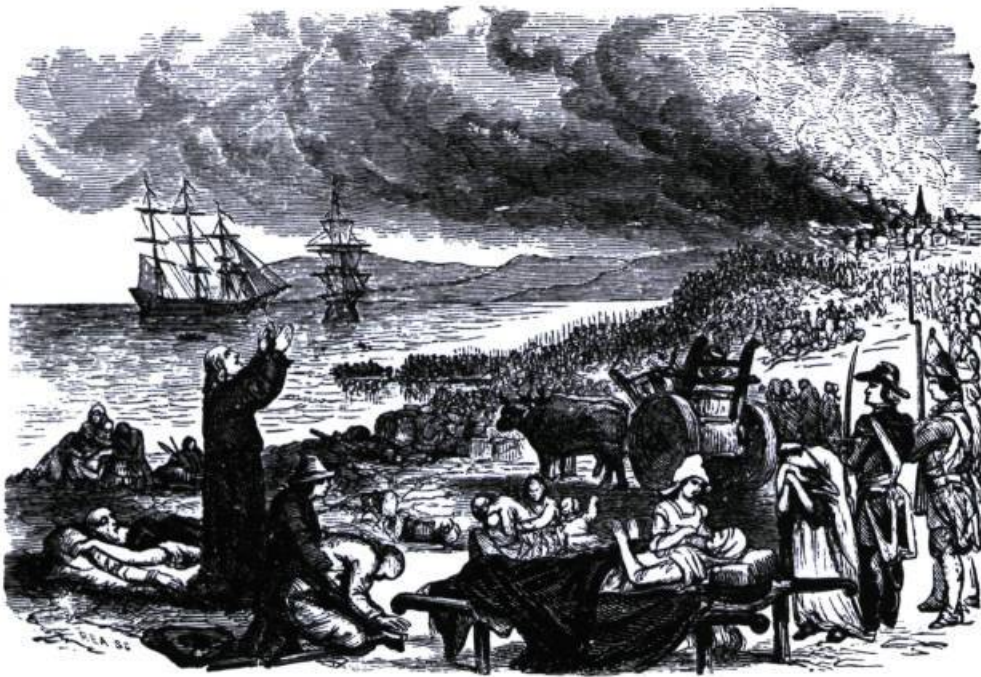
Gravure illustrant la déportation des Acadiens de Grand-Pré.