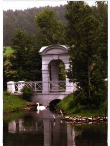
Le lac des Cygnes et le pont des Quatre-Vents. À l'arrière-plan, le paysage charlevoisien.