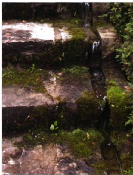
D'étroits canaux parcourent les marches des escaliers qui conduisent à la Salle des bassins.