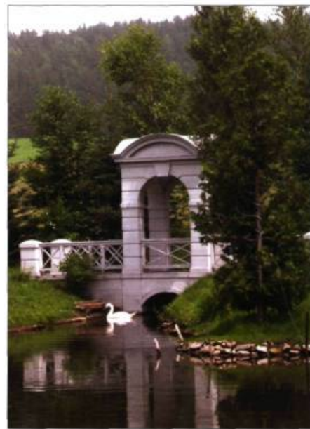
Le lac des Cygnes et le pont des Quatre-Vents. À l'arrière-plan, le paysage charlevoisien.