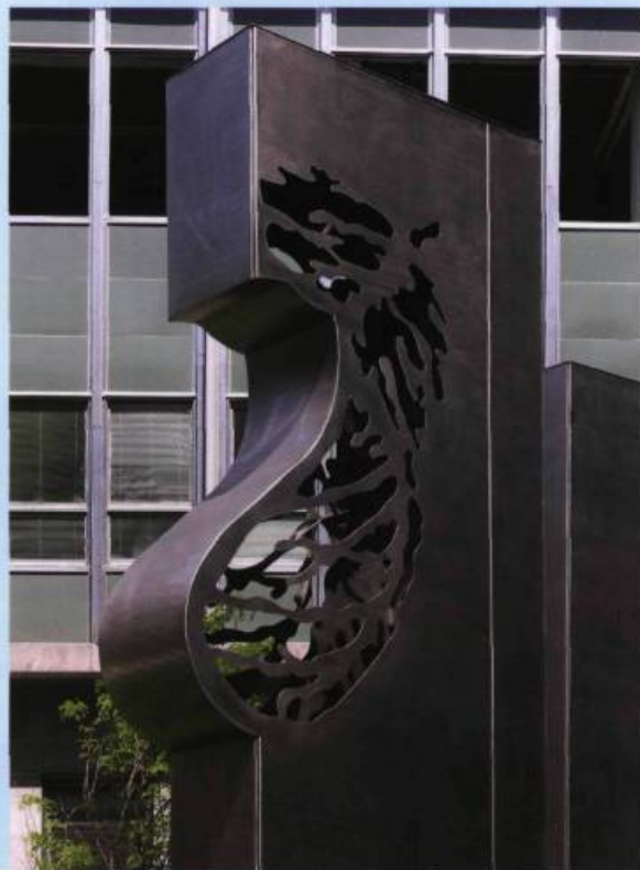
Pierre LEBLANC, Naissance, envol et vie... un cycle ou Pour la suite du monde , 2009. Détail/Detail. Acier inoxydable, lumière/Stainless steel, light. 5,6 x 15,2 x 12,1 m. Université Laval (Québec), Pavillon de médecine.