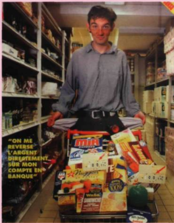
Matthieu LAURETTE, Apparitions: Produits remboursés , 2004. Détails / Details. Avec l'aimable autorisation / Courtesy of Manif d'art 3 , Québec. Photos: Ivan Binet.