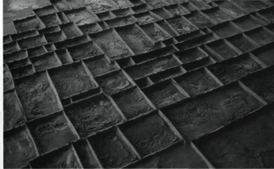
Laurent Pilon, projet pour la Clinique d'oncologie de l'hôpital Maisonneuve-Rosemont, Montréal. Moule, 1994. Argile et bandes de polypropylène (matrice linéaire : Laurent Pilon; modelé et rendu : Johane Jutras).