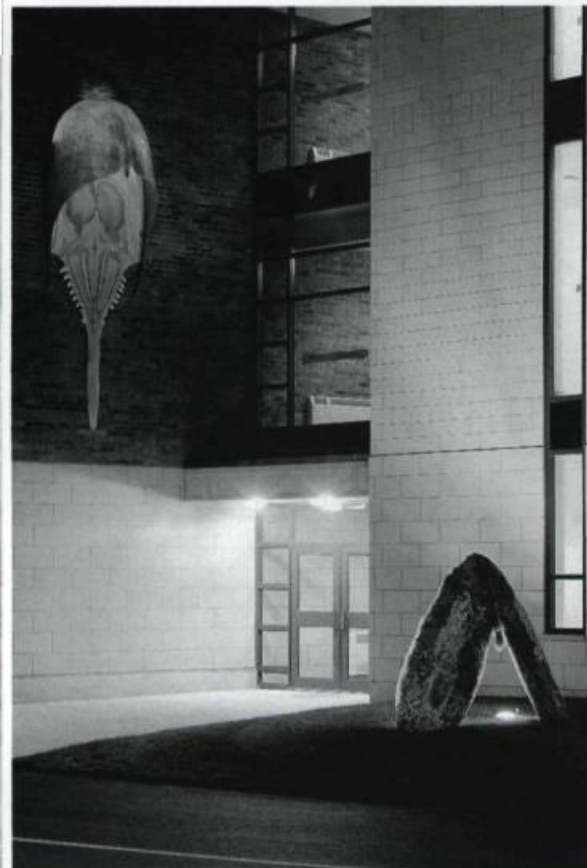
Laurent Pilon, Biface et limule , 1994. Résine et polyester. Cégep de Saint-Jean d'Iberville.