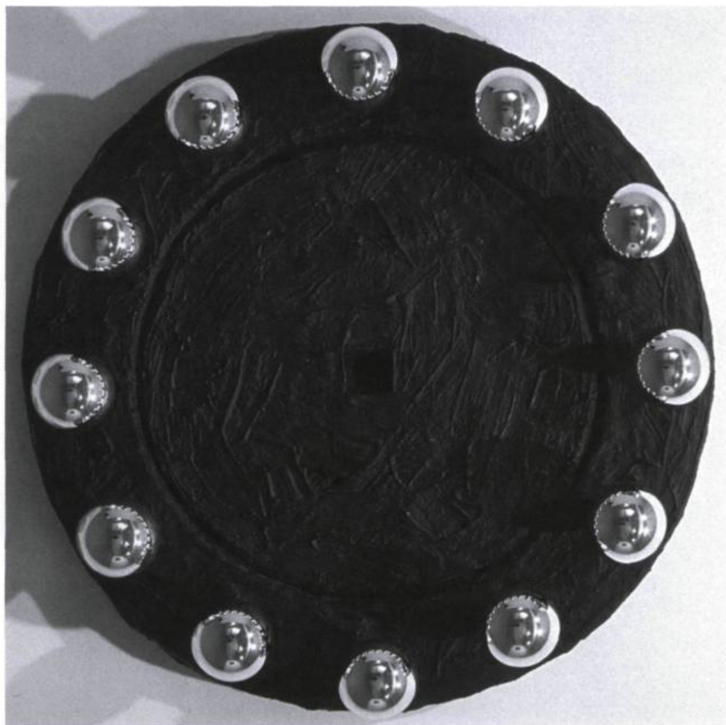
B. Radecki, Sans titre , 1992. Ciment, peinture, ampoules électriques, oxyde de fer.

Ce qui est vrai au niveau de la peinture au féminin et de sa critique pendant les années 1950-1970 l'est également alors (et peut-être encore aujourd'hui, à un degré moindre quand même) au niveau de la sculpture, pratique artistique que par tradition on