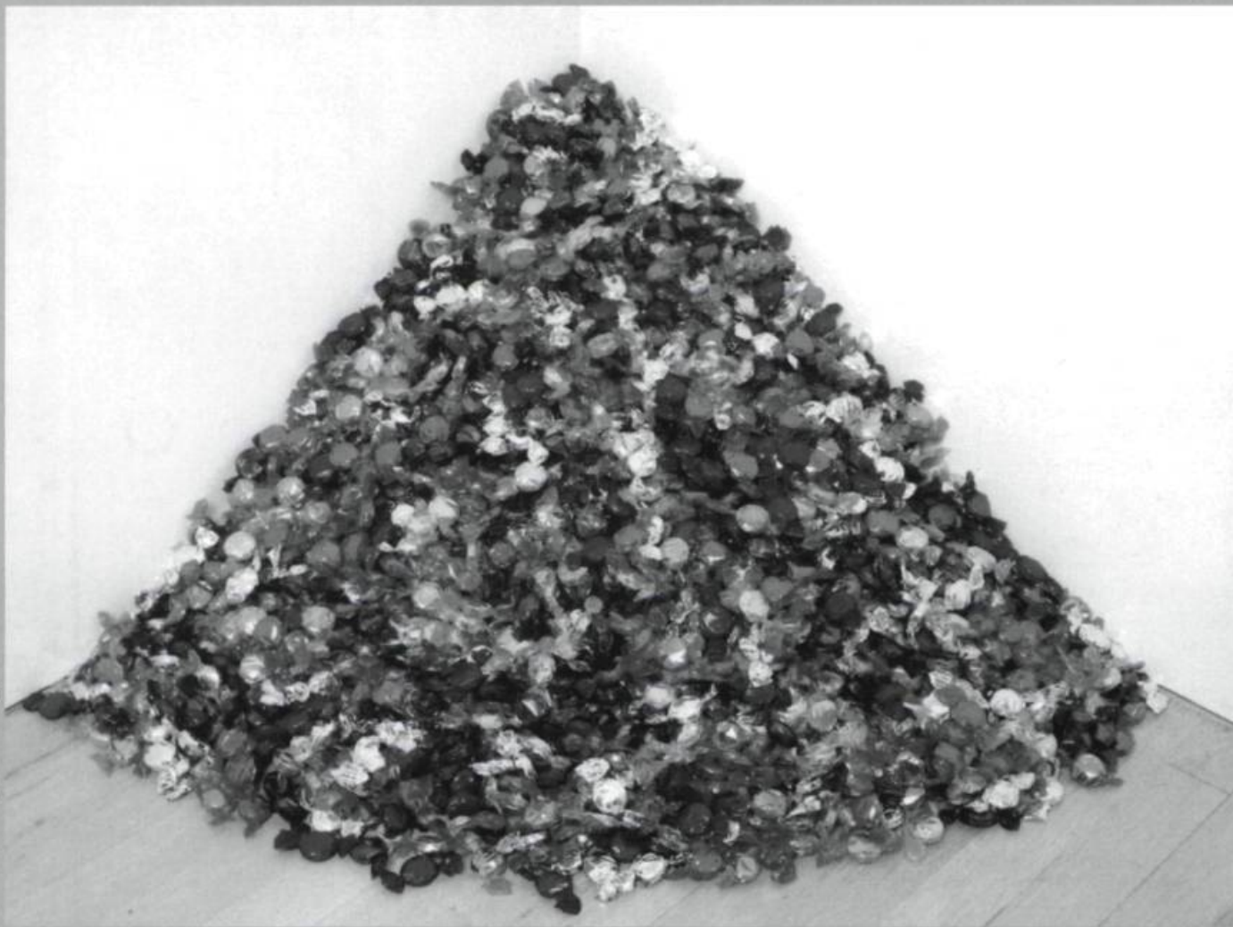
Félix Gonzalez-Torres, Untitled (Portrait of Ross in L.A.) , 1991. Culbutes. Œuvres d'impertinence . Musée d'art contemporain de Montréal.

la page, organisée par notre Bibliothèque nationale. La proposition de la conservatrice Sylvie Alix n'était pas sans mérite, d'autant que le corpus est foisonnant et de qualité inégale, et que ce type d'artefact est probablement le plus difficile à mettre en exposition, pour des raisons évidentes de fragilité et de sécurité. En outre, les équipements actuels de la BNQ secrètent toujours une profonde tristesse qui faisait