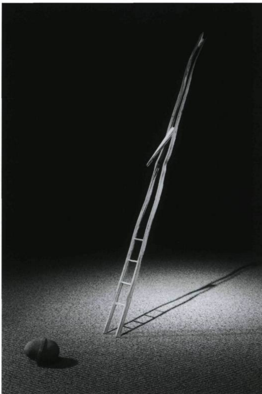
André Du Bois, Tension oblique , 1999. Bois, pierres, papier, fil. H. : 1 m.

Les connotations « figuratives » des installations de Du Bois relèvent de l'imaginaire, telle une projection de sa propre expérience de vie. Le bois qu'il emploie continue de vivre dans l'œuvre, même si cette vie n'est pas apparente. Il a sa propre histoire et, devenu sculpture, acquiert une nouvelle signification, une autre configuration. Dans Créature sans titre (version IV, 1999) 1 , la juxtaposition audacieuse d'éléments en pierre et en bois ne procède d'aucune véritable logique. La pièce a quelque chose d'énigmatique, et fait penser aux débris qui s'entassent sur le fleuve au printemps. Deux bouts de bois s'élèvent à partir du sol alors qu'au centre de la pièce s'entassent ardoises, roches, pierres et bois naturels — tout ce bric-à-brac étant maintenu en suspension à mi-hauteur de l'œuvre, n'étant retenu apparemment que par quelques tiges et fils métalliques. Légère, aérienne, cette Créature sans titre dégage robustesse et vitalité, symbolisant tout ce potentiel de puissance que recèle la nature. À l'instar d'autres œuvres de Du Bois, elle