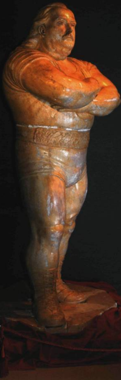
Robert PELLETIER, Monument Louis Cyr, 1969.

Dans la section de l'exposition consacrée à celui que l'on surnommait le « roi de la force », on trouve le moulage grandeur nature du monument prêté par le Musée de la Civilisation. Pouvez-vous nous retracer l'histoire de l'œuvre qui, je crois, débute avec une campagne de souscription ?