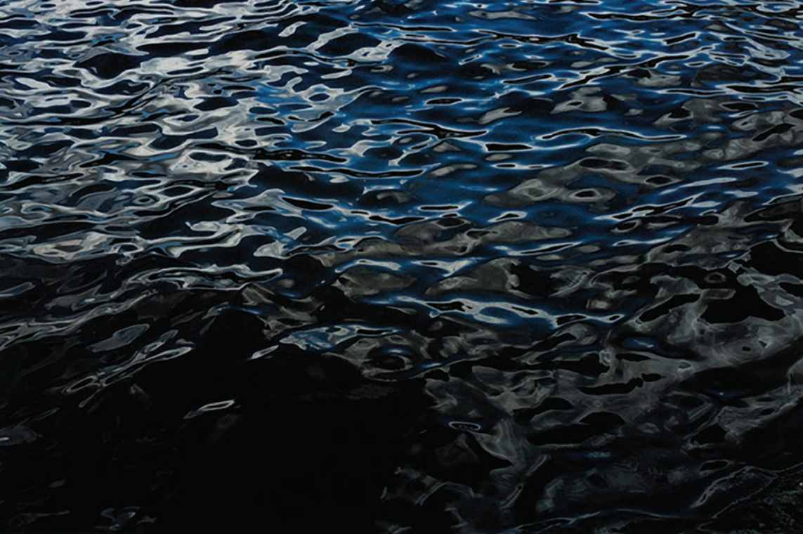
Roni Horn, Some Thames , Photographie.

ques du paysage et du portrait favorise une prise de conscience de l'acte de résistance des eaux du fleuve à une capture photographique simplement documentaire qui aurait tout banalisé en proposant un regard neutre. D'où le registre étendu de la mission photographique toute personnelle de Roni Horn et de la paradoxale infinitude de son projet qui portait la mutation continue de la course emportée du fleuve. Elle a compris que cette énergie est fondamentalement fluide et que toute saisie photographique de l'eau est limitée par l'espace et le temps, et qu'elle doit forcément passer outre à ces limitations et faire place aux incertitudes, au doute 7 . Sa dubitative acuité perceptive commande également la nôtre. Nous voici aux prises avec une difficile et obsessionnelle opération d'identification des ressemblances, des différences, questionnant le choix de l'objet photographié, le cadrage, la série, les variations et réfléchissant aux interprétations possibles. De plus, les fascinantes images s'accumulent et se bousculent, met-