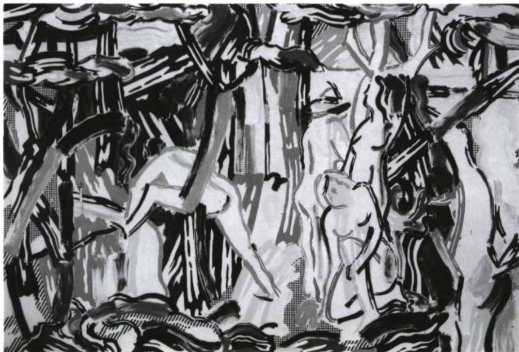
Roy Lichtenstein, Forest scene with figures , 1987. Huile et magna sur toile; 305 x 407 cm. Collection privée, Paris

«Le pop art renverse les valeurs. Les images de masse, tenues pour vulgaires, indignes d'une consécration esthétique, reviennent dans l'activité de l'artiste, à titre de matériaux, à peine traités. J'aimerais appeler ce renversement le «complexe de Clovis» : comme saint Rémi s'adressant au chef franc, le dieu du pop art dit à l'artiste : «Brûle ce que tu as adoré, adore ce que tu as brûlé.» Roland Barthes, L'obvie et l'obtus , (p. 181-182)