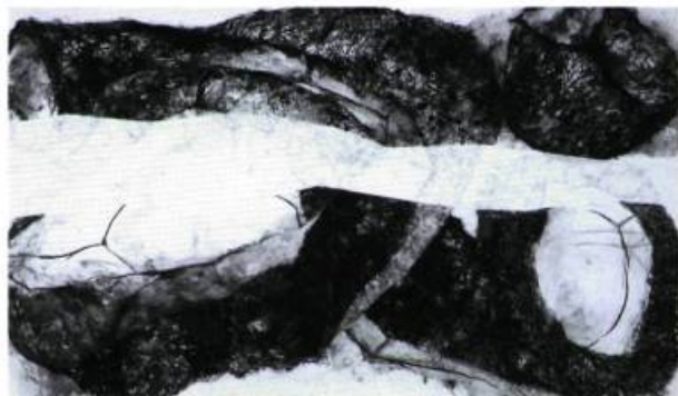
Renée Lavaillante, Tout, cependant, intéresse ses yeux n°2 , 1997. Technique mixte sur papier. 188 x 310, 5 cm.

Le titre comme cette bousculade formelle monumentale sur la surface de papier à laquelle s'oppose la bande aveugle qui frustre, castré littéralement le regard de la vision, est le signe d'un bouleversement substantiel dans la production de Renée Lavaillante. Pour en comprendre