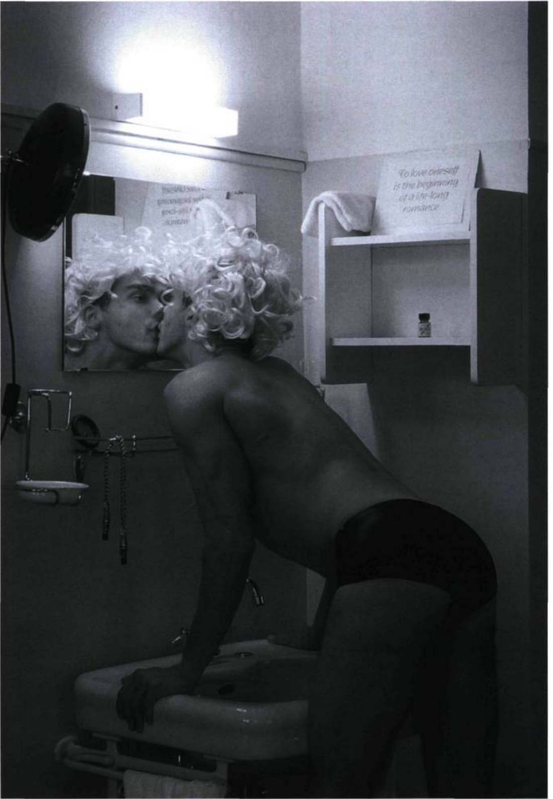
Matthias Hermann, To love Oneself is the Beginning of a Life-Long Romance , de la série Hotel 2/Gargellen , 1998. Photographie.