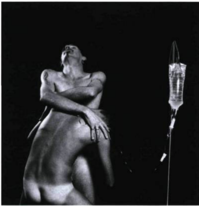
Jamie Dunbar, Positiv Sex Happens , 1993. Épreuve argentique ; 51 x 51 cm. Collection de l'artiste.

Dès lors, la diversité et la multiplicité des points de vue, la création d'une iconographie spécifique et la diffusion des images dans des lieux spécialisés tendent à mettre en valeur des attributs particuliers, c'est-à-dire un champ autonome de la représentation qui serait propre à cette forme d'art. Cependant, prendre en considération la subdivision des œuvres par catégories identitaires n'est-il pas un projet utopique ? Faire d'une œuvre d'art un modèle représentatif d'une collectivité, n'est-ce pas la confiner à ne représenter qu'une seule réalité ? Après tout, réussir à regrouper sous l'intitulé « art gay » l'expérience commune d'une sensibilité particulière, d'un désir de légitimation et d'un vouloir d'autoréalisation d'une identité gay à travers une masse opaque de contraintes socio-politiques constitue un défi.