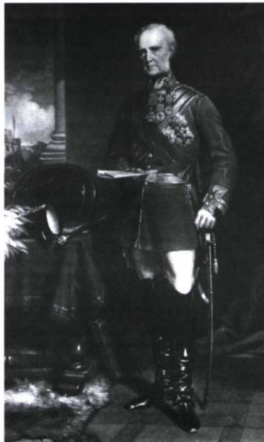
Sir John Colborne, commandant des forces armées au Canada pendant la rébellion. (Toile de G. W. Fisher, gravé par James Scott,)