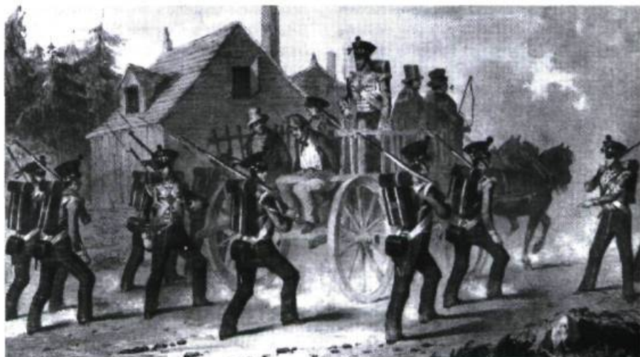
Des soldats anglais escortent des insurgés vers la prison de Montréal. (Dessin de M. A. Hayes gravé par J. H. Lynch, Archives Nationales du Canada)

Je m'attacherai ici à démontrer comment l'iniquité de ces procès a contribué à faire des Patriotes les martyrs et les héros des Québécois francophones. Ce sera une démonstration en deux parties : la première se vaudra une mise en lumière des iniquités perpétrées sous l'égide de la Loi martiale en 1839 et qui ont valu aux condamnés la sympathie de la population. Les emprisonnements, la composition du Tribunal militaire et le déroulement des procès y seront successivement abordés. La seconde partie de ce travail s'attachera à démontrer que les condamnés de 1839 sont bel et bien demeurés des martyrs dans la mémoire collective du Québec, et ce jusqu'à nos jours. Cette partie se subdivisera en cinq points d'analyse, soit (1) l'historiographie canadienne-française, (2) les