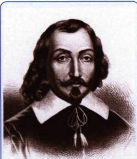
Le plus connu des « portraits » de Samuel de Champlain, fondateur de Québec, a été fabriqué à partir de celui de Michel Particelli d'Émery, surintendant des Finances sous Louis XIII.

Champlain a effectué 23 traversées de l'Atlantique et passé plusieurs hivers en Nouvelle-France. Il a négocié avec les Amérindiens, arbitré leurs disputes, établi des alliances et mené la guerre contre les Iroquois, étant même gravement blessé au cours de la seconde bataille. Après avoir exploré plus de 2400 kilomètres le long du Saint-Laurent et quelque 2000 kilomètres de la côte atlantique, il a poursuivi ses explorations jusqu'au lac Huron et