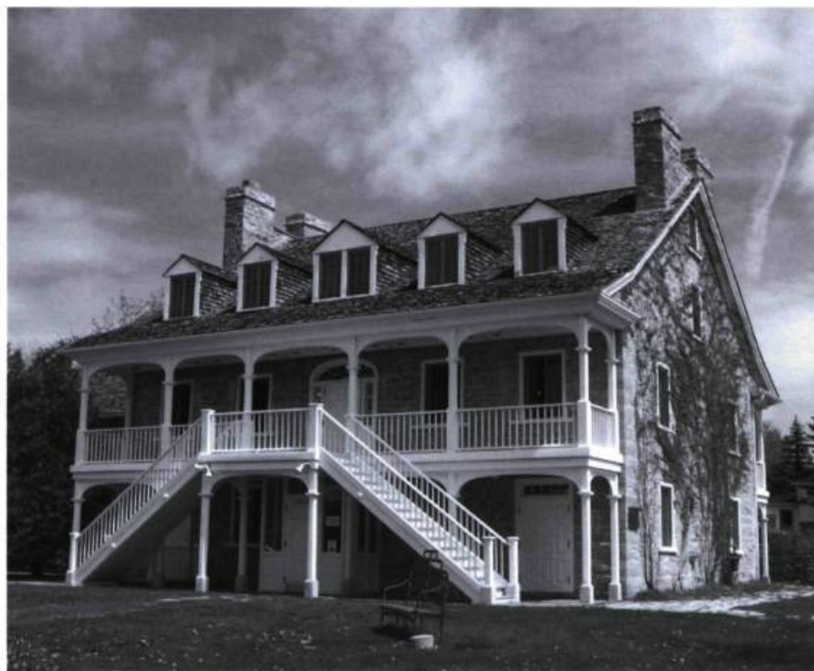
L'auberge Symmes à Aylmer, telle qu'on peut la voir aujourd'hui.