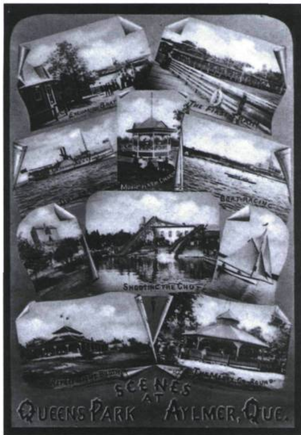
Queen's Park, Aylmer. Carte postale, Musée de l'Auberge Symmes, Gatineau.

acres qui attirait des gens de partout en Amérique du Nord. Malheureusement, l'incendie qui rasa en 1915 le célèbre hôtel Victoria, à proximité de la marina et de Queen's Park (le parc d'attraction), et la fermeture définitive du parc d'amusement à la fin des années 1920 allaient marquer le glas d'Aylmer comme centre majeur.