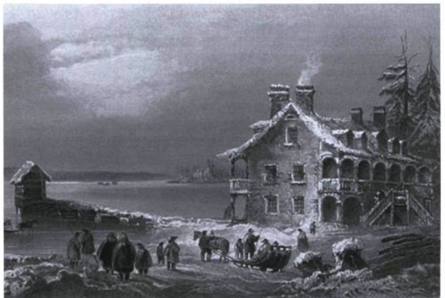
Illustration de l'auberge Symmes, Aylmer (Gatineau), 1842, par William H. Bartlett, dans Canadian Scenery.