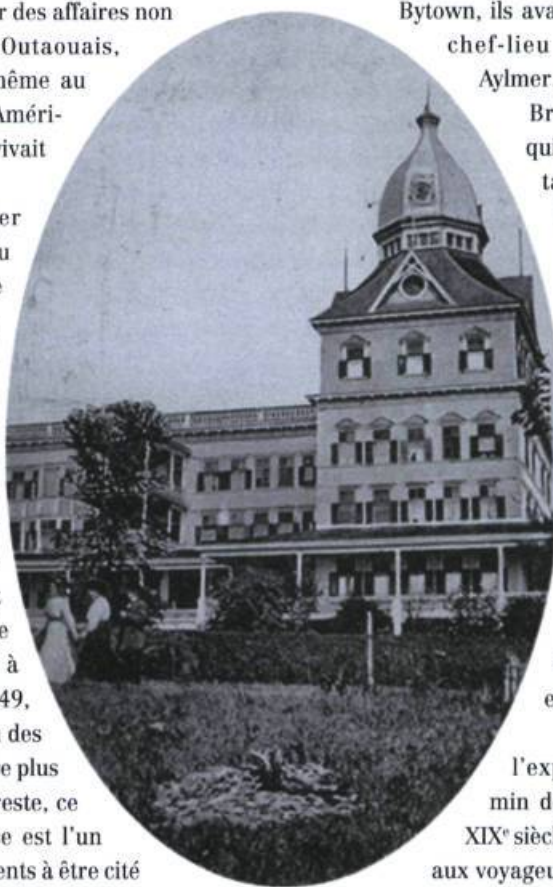
Hôtel Victoria, Aylmer, BNQ

En dépit de tout, Aylmer sut demeurer pendant un certain temps un centre de villégiature très recherché, notamment en raison de sa piste de course (Connaught) et surtout de son parc d'amusement de 80