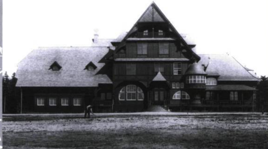
Jardinier devant la Villa. Photographie montrant l'ampleur de cette construction.

briques avec mitron à ressauts, un toit à pignon parfois orné d'un épi décoratif, ou encore des larges saillies au toit et à la couverture des lucarnes, à la façon des habitations des montagnes.