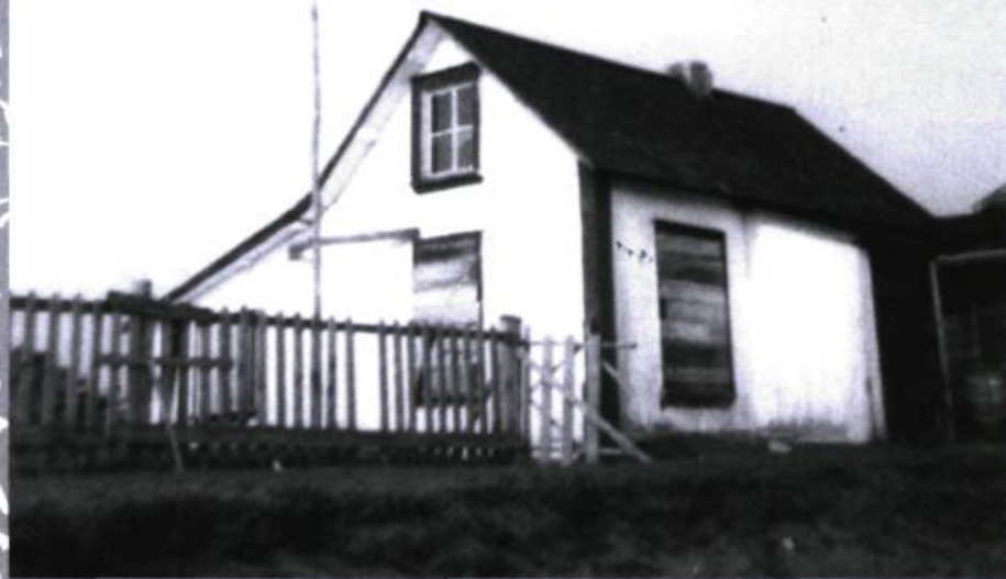
Prise en août 1946, cette photographie présente un ancien poste de la Baie d'Hudson, celui de Mingan, maintenant abandonné.