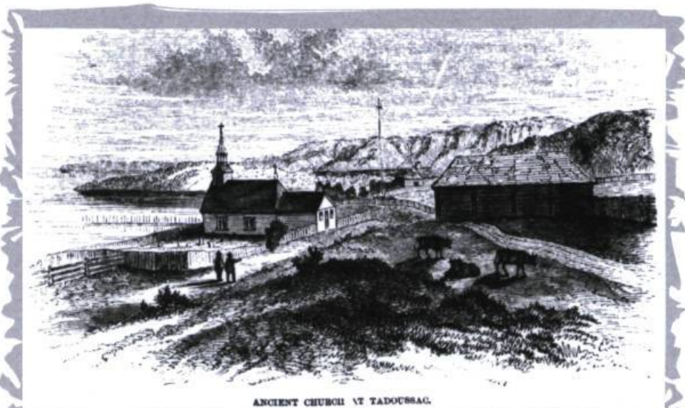
ANCIENNE CHURCH ET TADOUSSAC.

apprécié mon dessin de la baie et du plateau, avec ses filets au second plan, qu'il me fit don d'une magnifique truite de mer toute fraîche qui nous permit, à trois, de déjeuner le matin suivant. Le dessin de la vieille chapelle nous fait d'ailleurs voir la plage où se pratique la pêche, ainsi que le promontoire rocheux de l'islet qui sépare la baie de Tadoussac et les eaux sombres du Saguenay avec ses rives montagneuses. Tadoussac est à 130 milles de Québec. Depuis la fondation de la Compagnie de la Baie d'Hudson, voilà plus d'un siècle et demi, l'endroit demeure un poste de traite de cette compagnie où résident un des associés et un agent 2 . Ils ont là une jolie demeure d'un étage et les quelques bâtiments d'appoint nécessaires au commerce, une place du drapeau flanquée de deux