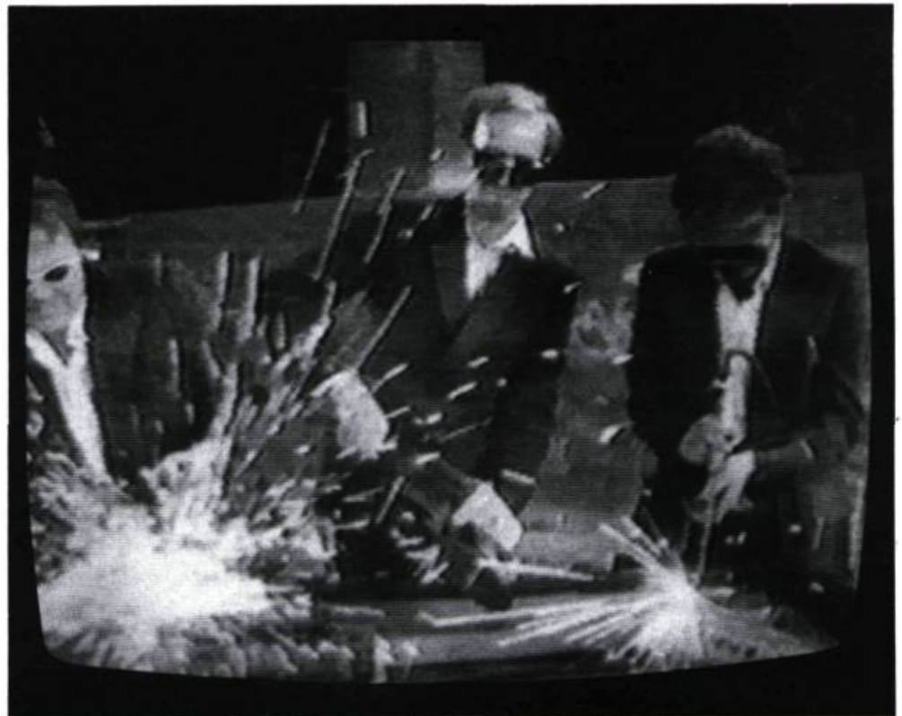
Close to the Edit d'Art of Noise. «Le réalisateur Zbigniew Rybczinski renoue avec la tradition du manifeste.»

C'est par son propos que Close to the Edit (1984), réalisé par Zbigniew Rybczinski pour Art of Noise, présente de l'intérêt. Contrairement à Tango (1982) et Imagine (1987) du même auteur, ce n'est pas l'aspect technique qui fait écarquiller les yeux ici, mais l'action et ce qu'elle met en valeur comme idée. Avec une froideur appliquée, presque comme des automates, trois hommes vêtus de noir obéissent à une enfant aux allures punk et pulvérisent piano, contrebasse, violon et saxophone à coups de scie électrique et de tronçonneuse. Sans même un mot, Rybczinski renoue avec la tradition du manifeste. On pense en effet aux avant-gardes historiques réclamant le balayage de l'ancien et l'instauration d'un art nouveau : le temps des instruments traditionnels est révolu, vive le synthétiseur !