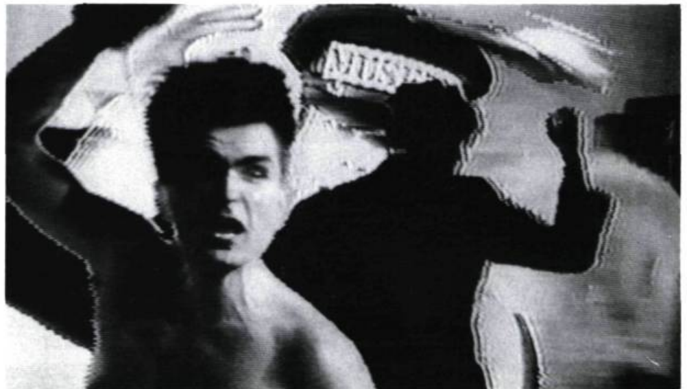
I Am Monty Cantsin de Neam Cathod: clip-concept

Mais en matière de vitesse, avec I Am Monty Cantsin (1989) du Montréalais Neam Cathod, on entre dans les ligues majeures! Entièrement réalisé en vidéo, ce clip-concept montre Monty Cantsin, activiste et anarchiste néoiste, chantant devant un fond d'images puisées dans les archives des performances de l'artiste. Montées ou, plus exactement, composées à partir des structures musicales de la pièce (on est loin du placage des images sur une «toune»), ces images ont une durée variant de 1/60 de seconde à quelques secondes tout au plus et défilent donc à une vitesse souvent bien en deça du seuil de la perception. Plongé en plein subliminal, on en sort sidéré et un peu inquiet de la fiabilité de nos sens. Grisant! ■