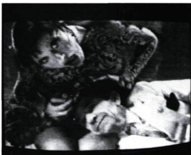
Let Be Must the Queen de Guesch Patti: la provocation au-delà du racolage

Bizarre Love Triangle de New Order réalisé par Robert Longo. À la limite de l'illisible, cet œil vous regarde pendant 1/30 de seconde.