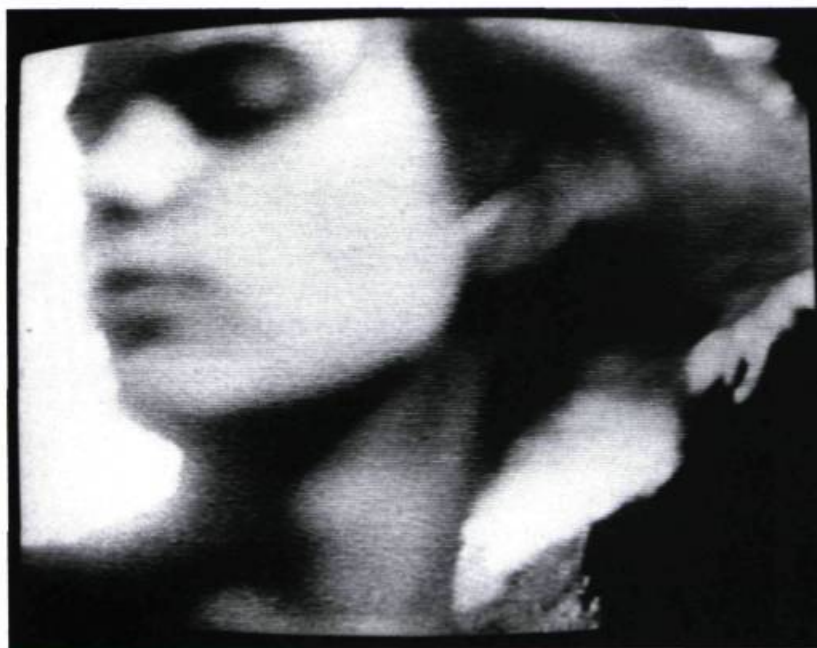
How Soon Is Now de The Smiths réalisé par Paula Greif: la distorsion volontaire