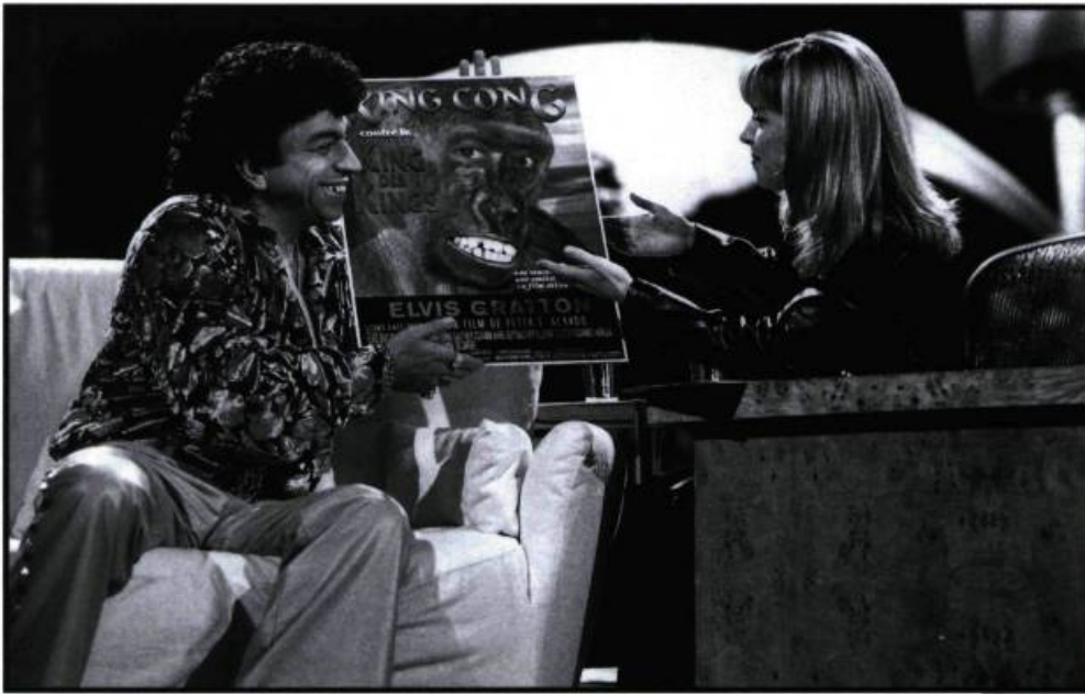
Bob Gratton, vedette des émissions de variétés, ici chez Julie Snyder. Qui vend quoi?