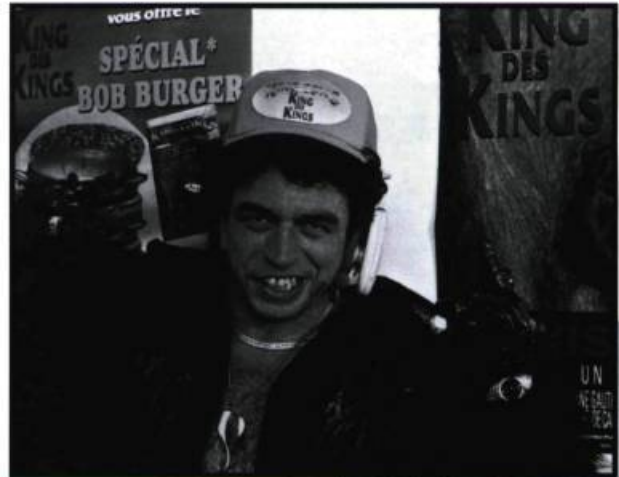
Quand le succès aide à vendre des hamburgers.