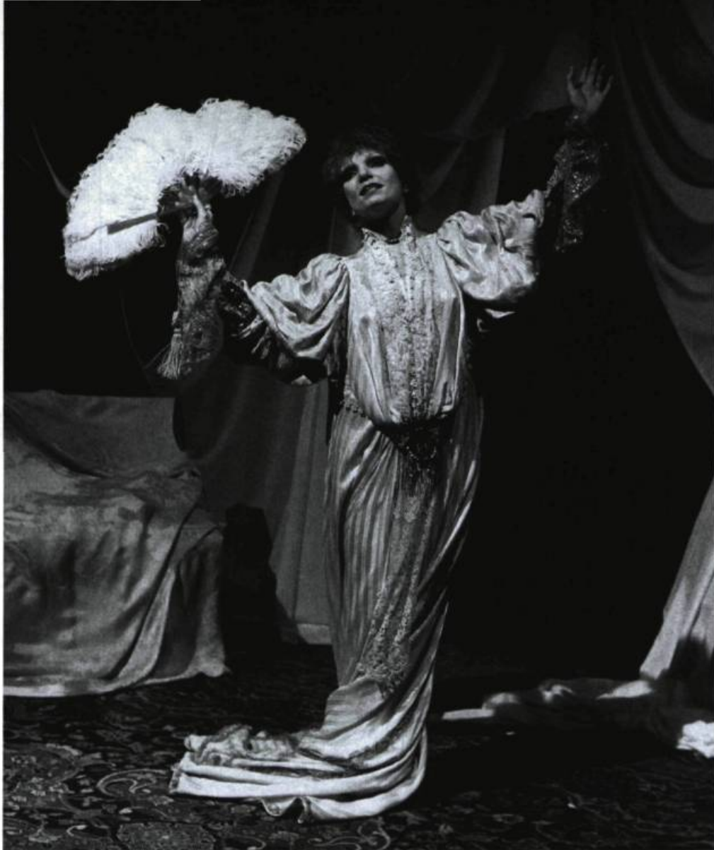
Monique Leyrac dans Divine Sarah (TNM, 1982).