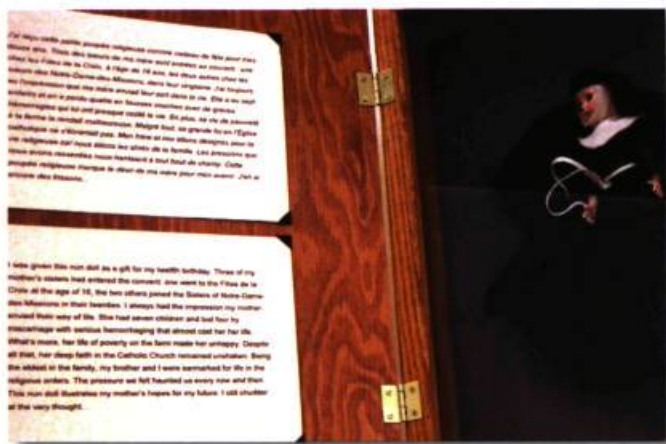
Détail de Calvaire ? de Diane Lavoie, techniques mixtes, 31,5 cm x 38 cm x 7,5 cm, 2006.