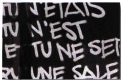
Tu n'est... de Nathalie Dupont, photo numérique, 2006.