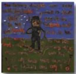
Farmer de Denis Prieur, plume feutre et acrylique sur contreplaqué, 24 po x 24 po, 2004.