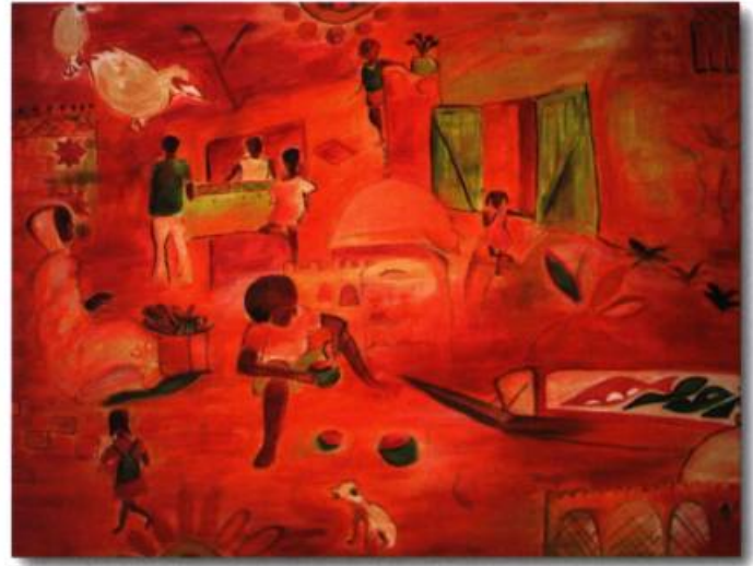
Sénégal en rose d'Anna Binta Diallo, huile sur toile, 5 pi x 4 pi.