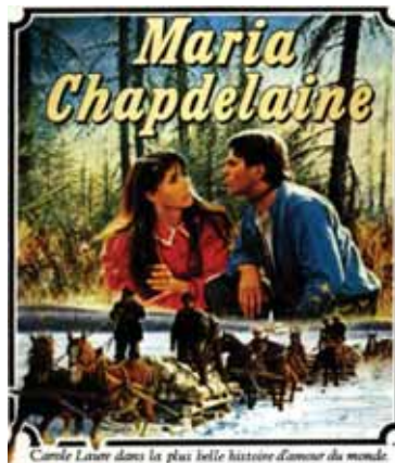
Affiche du film de Gilles Carle, 1983.