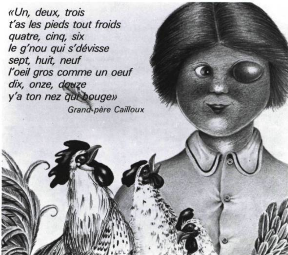
illustration: Philippe Béha — Lune en or