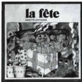
Ginette Anfousse LA FÊTE ET L'ÉCOLE Illustré par l'auteure Éd. La courte échelle, 1983, 24 pages. 4,95 $