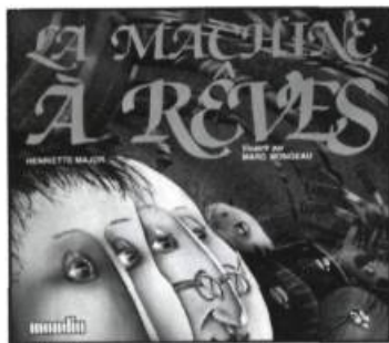
Henriette Major LA MACHINE À RÊVES Illustré par Marc Mongeau Éd. Mondia, 1984, 24 pages. 3,75 $

M. Toulmonde ne rêve plus. Ni éveillé, ni endormi. Voyageant au pays de Nimportout, il rencontre un certain M. Machinchouette, inventeur de machines de toutes sortes. Ce dernier doit bien posséder une machine à rêves. Oui... mais elle est très spéciale. C'est un livre... intitulé La machine à rêves .