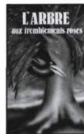
Danièle Simpson L'ARBRE AUX TREMBLEMENTS ROSES

Illustré par Renée Grégoire Éd. Paulines, collection Jeunesse-Pop; Science-fiction, 1984, 103 pages. 4,95 $