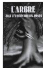
Danièle Simpson L'ARBRE AUX TREMBLEMENTS ROSES

Illustré par Renée Grégoire Éd. Paulines, collection Jeunesse-Pop; Science-fiction, 1984, 103 pages. 4,95 $