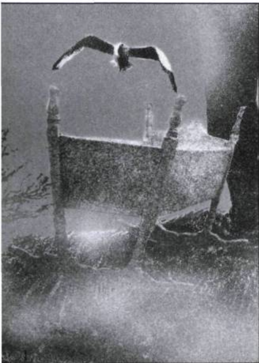
Tiré de Le tour de l'île illustration: Gilles Tibo

«Parfois tu sais, on peut vouloir que quelqu'un meure, on peut le souhaiter même, quand cette personne nous contrarie ou qu'elle prend trop de place, tu n'es pas responsable de sa mort pour autant.»