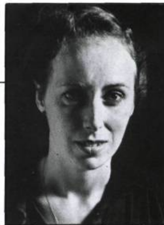
par Ginette Guindon

C'est d'ailleurs le cas de plusieurs autres thèmes peu ou pas exploités par les francophones. La littérature québécoise de langue française se cantonne pudiquement dans la mort des parents ou des grands-parents. Chez les anglophones, les causes de la mort ne sont pas uniquement la maladie ou les accidents de la route, mais on y voit aussi le suicide, le terrorisme, les hold-up, les catastrophes naturelles, etc. J'ai même trouvé un livre américain pour enfants sur la réincarnation. Bref, le thème est analysé sous plusieurs facettes.