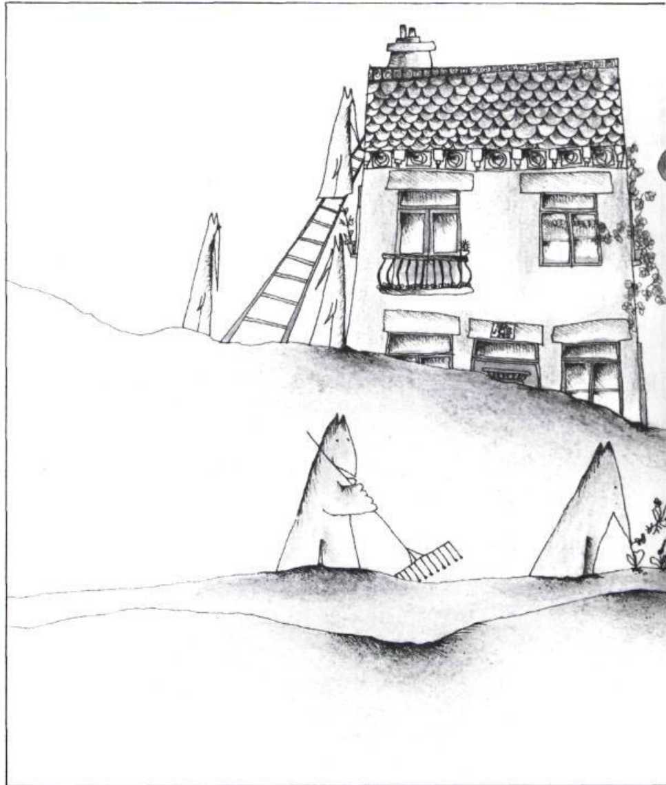
illustration de Christiane Duchesne pour L'enfant de la maison folle

Aux éditions de La maison folle , la démarche est très différente. Christiane Duchesne, que j'ai rencontrée, est déjà