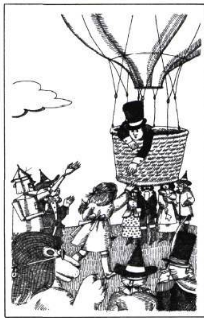
L'enchanteur du pays d'Oz , de Marie-Andrée Warnant-Côté, Montréal 1977, les Editions Héritage, Collection Pour lire avec toi. Illustrations de la page couverture en couleur et 10 illustrations intérieures en noir et blanc.