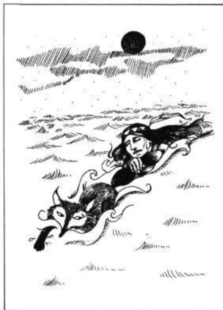
Les tours de Maître Lapin , de Marie-Andrée Warnant-Côté, Montréal 1976, les Editions Héritage, Collection Pour lire avec toi. Illustration de la page couverture en couleur et 11 illustrations intérieures en noir et blanc.