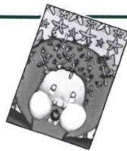
— Etoifilan, par Bertrand Gauthier, la courte échelle