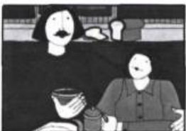
— Arnaud (Le Garçon au Cerf-Volant), par Monique Corriveau, Fides

1.Série des cartes postales distribuées aux enfants :