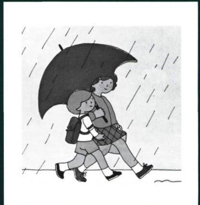
Le parapluie rouge , texte et illustrations de Cécile Gagnon, Montréal 1979, Les Editions Héritage, Illustrations en quatre couleurs et en bichromie.