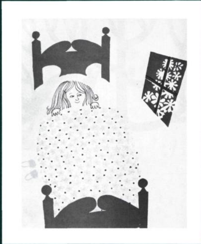
Martine-aux-oiseaux , texte et illustrations de Cécile Gagnon, Québec 1966, Les Editions du Pélican, Illustrations en bichromie.