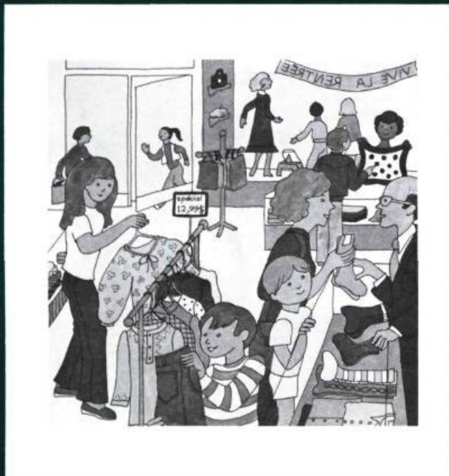
Moi et les miens , texte de Jean-Luc Picard, Montréal 1978, Centre éducatif et culturel, Illustrations en couleur.