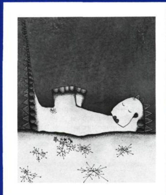
Le Triste Dragon , texte et illustrations de Christiane Duchesne, Montréal, 1975, Les Editions Héritage, Album broché de 16 pages, Illustrations en couleurs (Les enfants du roi Cléobule).