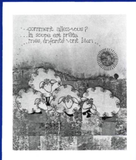
Lazaros Olibrius , Texte et illustrations de Christiane Duchesne, Montréal, 1975, Les Editions Héritage, Album broché de 16 pages, Illustrations en couleurs (Les enfants du roi Cléobule).