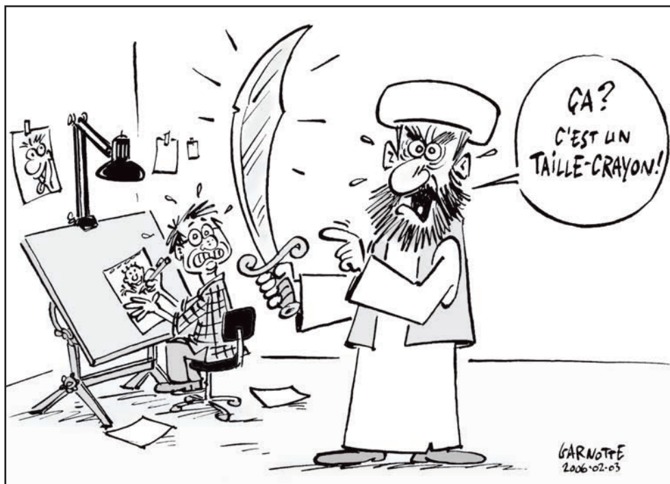
Garnotte, paru dans Le Devoir , 2006. Encre de Chine sur bristol, mise en couleur numérique

d'un travail herméneutique sur les sources et les textes fondateurs, que les religions peuvent prétendre à une libération.