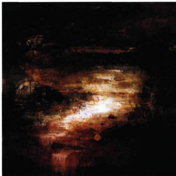
Visible Landlines, 2001 Huile sur toile 72" x 72"

Dans la genèse de l'œuvre de Kevin Sonmor, il y a d'abord des paysages, ensuite des natures mortes et plus récemment, des natures mortes dans des paysages. L'imbrication de ces deux genres en un seul donne lieu à de nouvelles compositions picturales complexes explicitées par leurs titres. Une riche syntaxe picturale composée de noir, de blanc, d'ocre, de bleu foncé, de rouge intense,