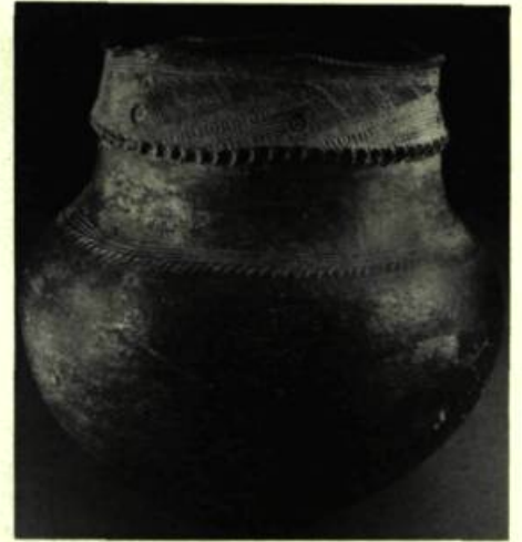
3. Vase en céramique de style iroquois.

La brièveté du récit de cette visite a provoqué de vives controverses au sujet de la location exacte d'Hochelaga et de la route que Cartier et ses hommes ont empruntée pour s'y rendre. Généralement, on pense qu'ils ont suivi le fleuve Saint-Laurent à peu près jusqu'à la hauteur de l'île Sainte-Hélène, même s'il arrive que certains érudits les fassent se rendre aussi loin qu'au pied des rapides de Lachine, ou que d'autres encore, adoptant la théorie de Beaugrand-Champagne, leur fassent remonter la rivière des Prairies, et situent Hochelaga sur le côté nord du mont Royal. Cependant, la location systématique d'Hochelaga au nord du fleuve, sur les cartes du 16 e siècle, semble confirmer que c'est bien le Saint-Laurent que Cartier a remonté, et qu'il ignorait l'existence de la rivière des Prairies, parallèle au fleuve. Le récit de voyage de Cartier précise toutefois qu'Hochelaga était située près du mont Royal, mais ne mentionne pas de quel côté. La preuve ethnographique suggère que les Indiens d'Hochelaga auraient préféré un sol sablonneux, facile à travailler, et le plus possible à l'abri du vent froid du nord. Aussi, Hochelaga se situait-elle probablement du côté sud ou sud-est du mont Royal. D'ailleurs, au 19 e siècle, le territoire situé directement au sud du mont Royal était encore très prisé pour la culture des arbres fruitiers.