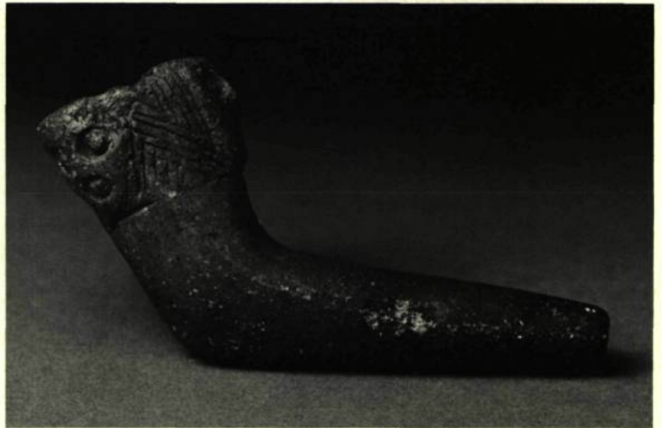
4. Pipe trouvée sur le site Dawson. Elle est faite d'argile et est ornée de trois visages humains stylisés.