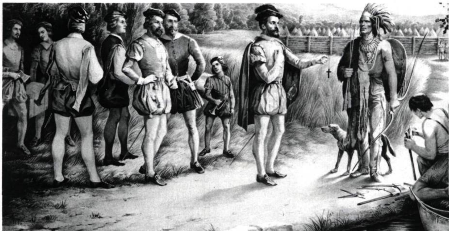
2. N. SARONY Première rencontre de Jacques Cartier avec les Indiens, à Hochelaga, en 1535. Lithographie (d'après un dessin d'Andrew Norris). New-York, 1850.