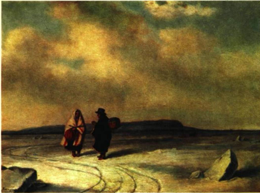
Cornélius Krieghoff, 1815-1872 : PONT DE GLACE PRÈS DE MONTREAL. Huile. 11" x 15".