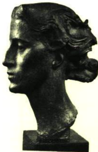
André Bizette-Lindet : TÊTE DE JEUNE FILLE. Bronze.

En définitive, ces tableaux, ces objets d'art sont aimés en dehors de leur matérialité, tout simplement parce qu'ils ont une âme et qu'ils reflètent une vie intérieure.