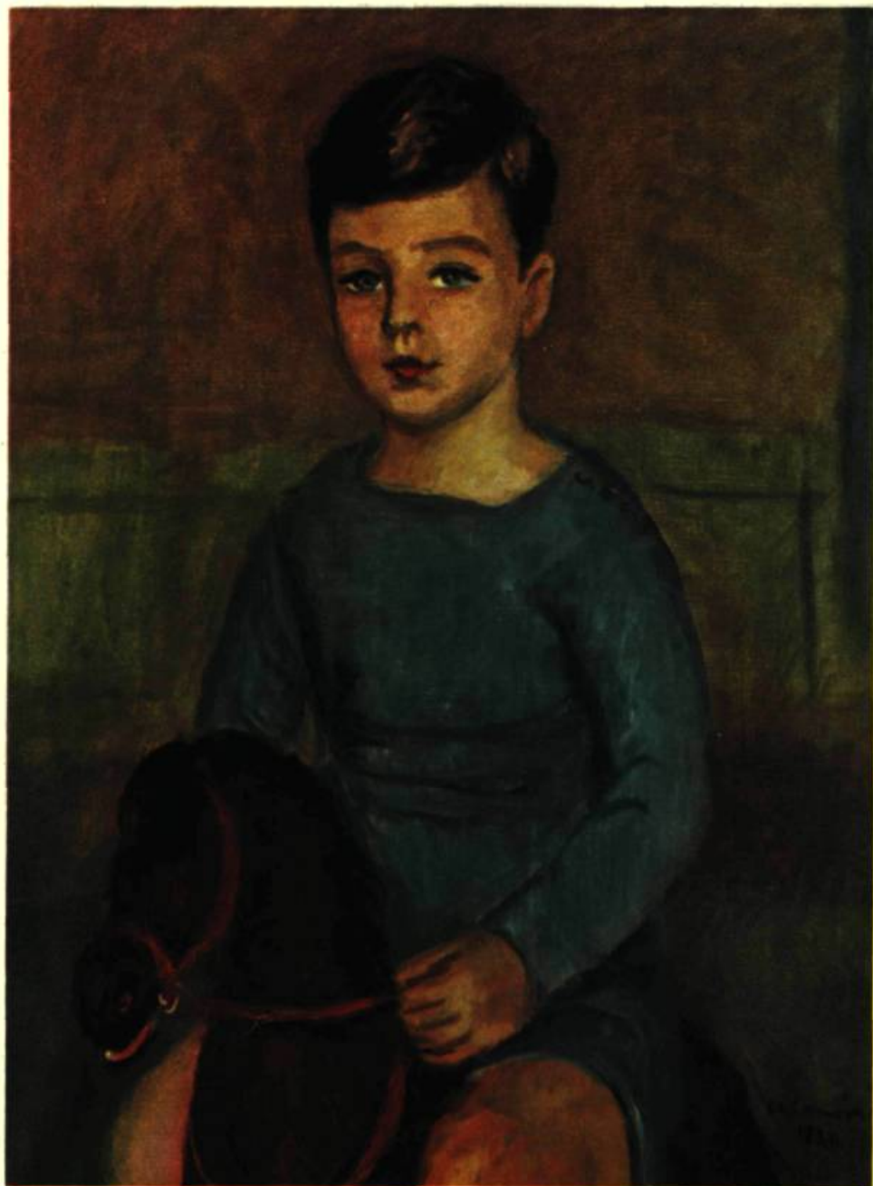
Charles Camoin : ENFANT AU CHEVAL. Huile. 1930. 17 \frac{1}{2} " x 23 \frac{1}{2} ".

Par contraste, deux petits tableaux de Krieghoff rappellent une expérience artistique bien différente. En effet, Pellan et Beaulieu, deux vigoureux peintres canadiens ont eu l'occasion de produire une oeuvre abondante en France, tandis que Krieghoff, un allemand d'origine, a surtout peint au Canada. Un de ces Krieghoff retient notre attention, non seulement par la qualité, mais aussi par la découverte que les propriétaires ont