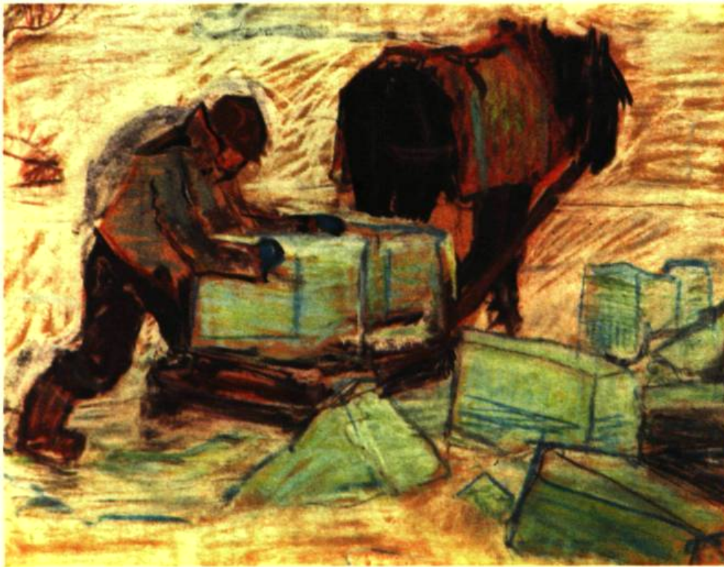
Clarence Gagnon, 1881- 1942 : COUPE DE GLACE. Gouache sur papier d'emballage. 12½" x 15¾".