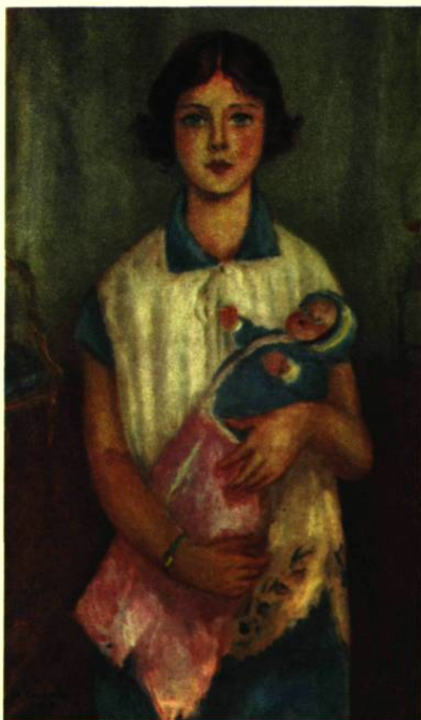
Charles Camoin, 1879; ENFANT À LA POUPÉE.

Charles Camoin n'est peut-être pas tellement connu au Canada. Né à Marseille en 1874, il travailla dans l'atelier de Gustave Moreau, où il fut le condisciple de Marquet. Très influencé par Renoir et Bonnard, il prit place parmi les Fauves, dans les années qui suivirent la première grande guerre. Par tempérament, cependant, il rebuta aux tendances extrêmes de certains de ses collègues, et il ne renia jamais complètement l'Impressionnisme où sa sensibilité s'exprimait avec le plus d'aise.