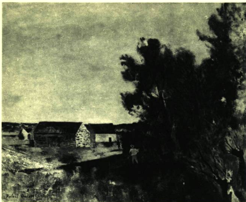
Georges Oudot, 1897 : EN ÎLE DE FRANCE. Huile. 25" x 31".