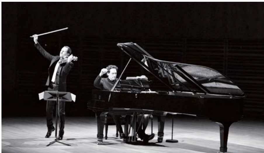
Récital de l'altiste Antoine Tamestit et du pianiste Shai Wosner à la salle Raoul-Jobin du Palais Montcalm (30 avril 2016).

Marie-Thérèse Lefebvre. Chronologie musicale du Québec, 1535-2004 : musique de concert et musique religieuse . Québec, Les éditions du Septentrion, 2009, 366 p.