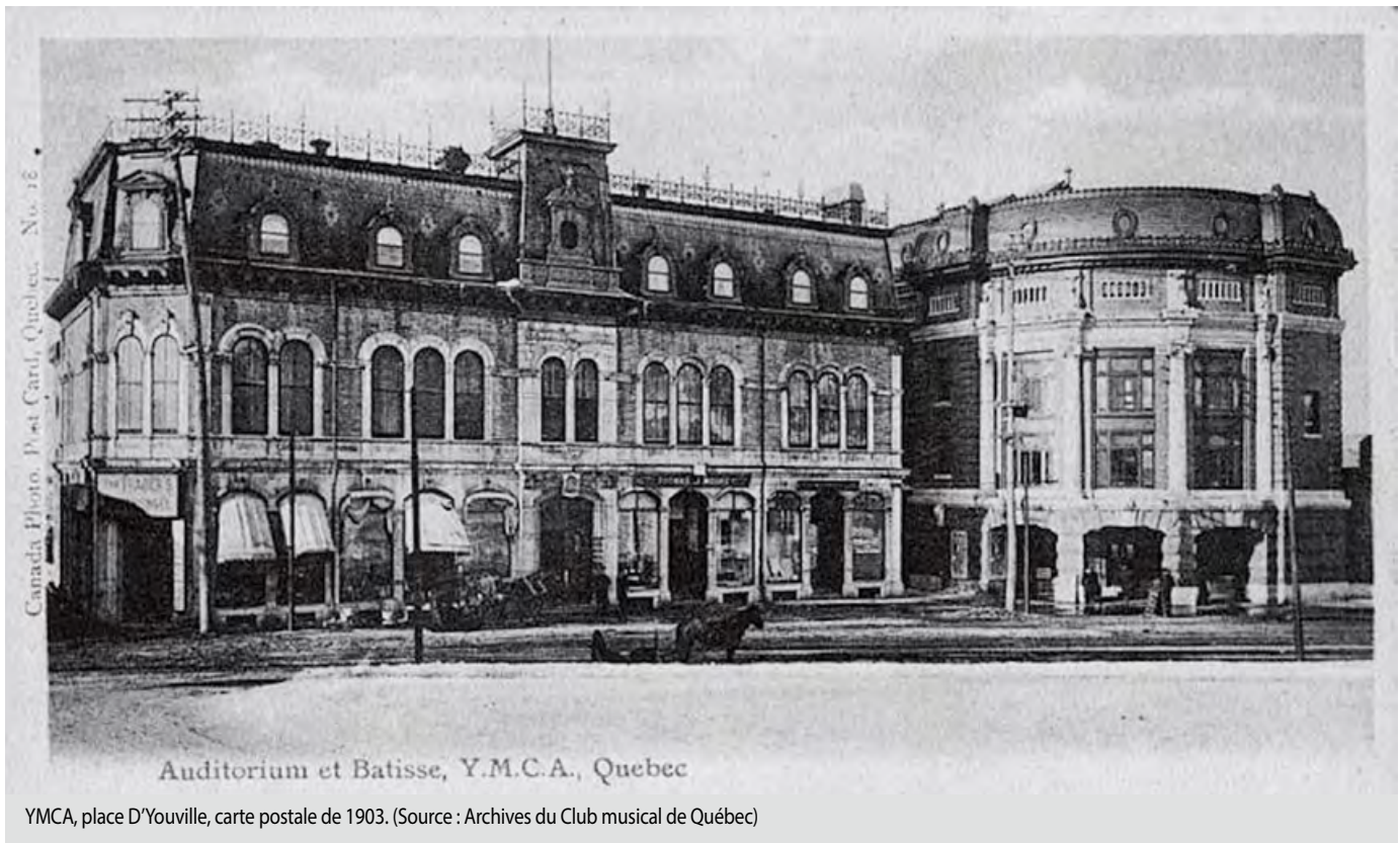
YMCA, place D'Youville, carte postale de 1903.

l'organisation. À cette époque, les magasins et les journaux sont nombreux à permettre au club d'afficher gratuitement les concerts à venir. Pour ce qui est du régime politique, il n'hésite pas à subventionner l'organisation, quel que soit le parti au pouvoir. On voit également des parlementaires éminents comme le premier ministre Louis-Alexandre Taschereau ou le secrétaire de la province de Québec Athanase David accepter de parrainer l'organisme.